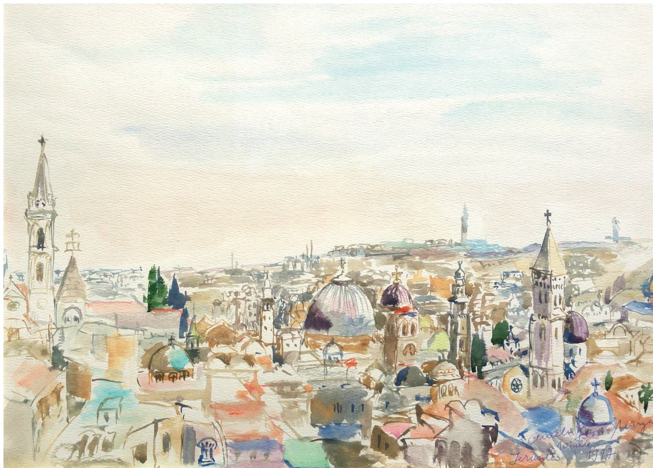
04. Ierusalim. Turnuri și cupole Jerusalem. Towers and Domes