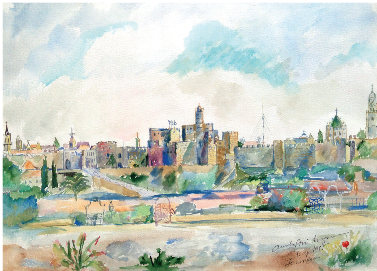
03. Ierusalim. Ziduri în primăvară Jerusalem. Walls in Spring