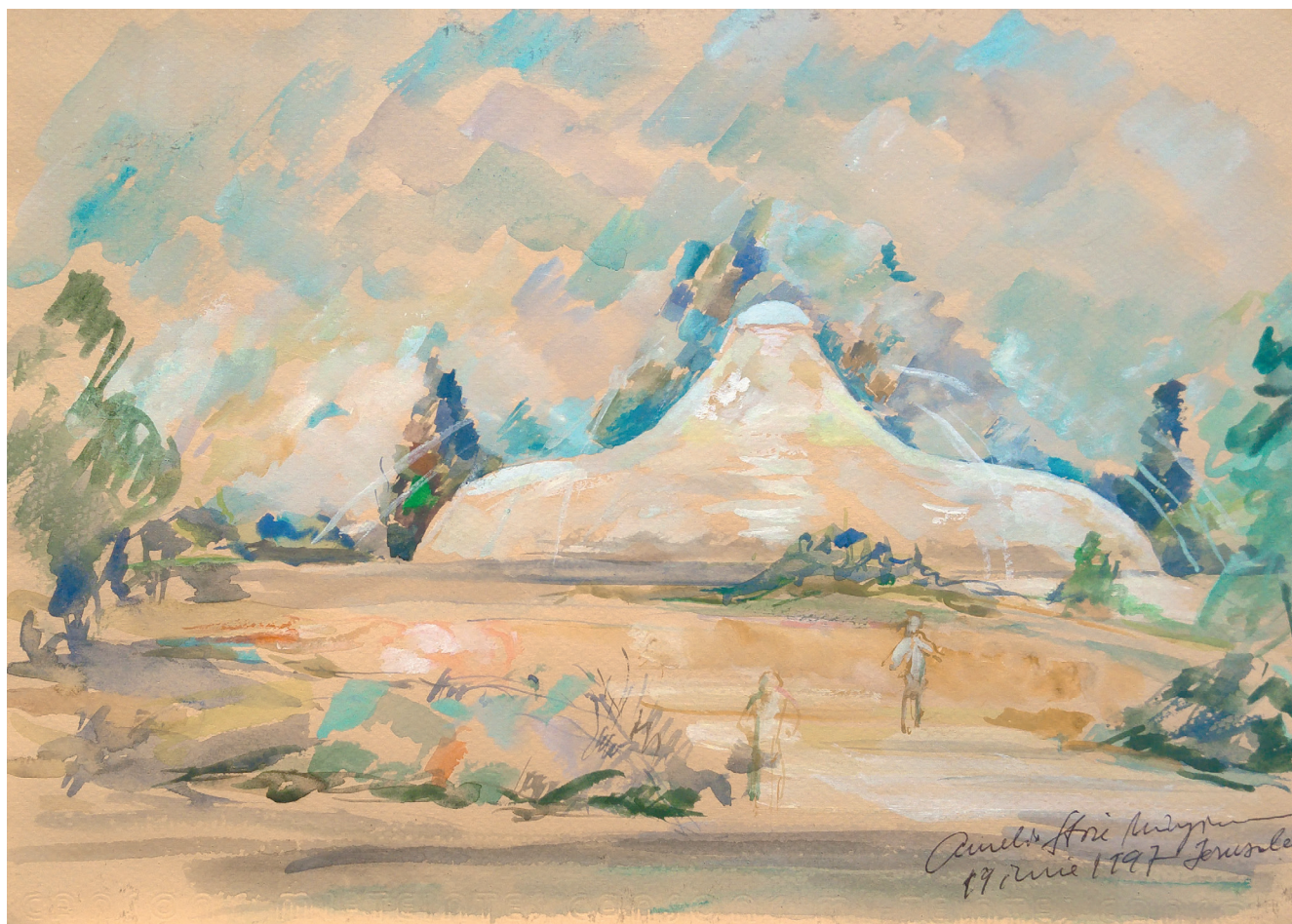
01. Ierusalim. Muzeul Manuscriselor de la Marea Moartă Jerusalem. The Dead Sea Scrolls Museum