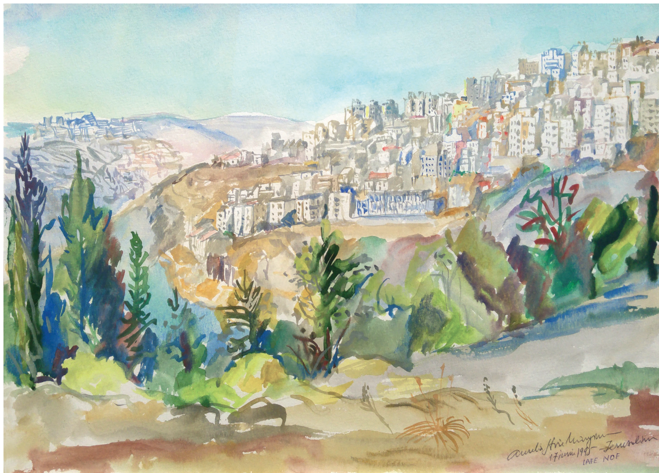
05. Ierusalim. Cartierul Jaffa Nof Jerusalem. Jaffa Nof Neighbourhood