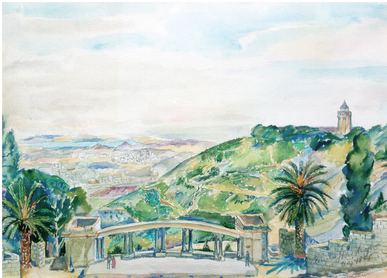
02. Ierusalim. Marele amfiteatru în aer liber Jerusalem. The Grand Open-Air Amphitheatre